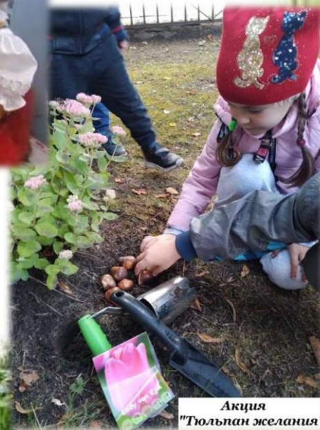
Акция "Тюльпан желания"