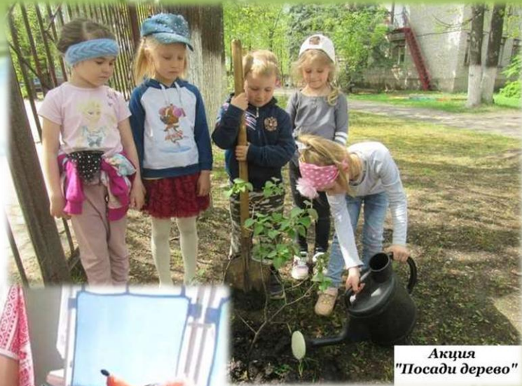
Акция "Посади дерево"